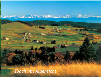
Ibach mit Alpensicht