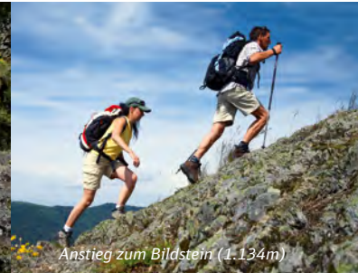
Anstieg zum Bildstein (1.134m)