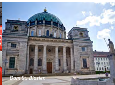
Dom St. Blasien